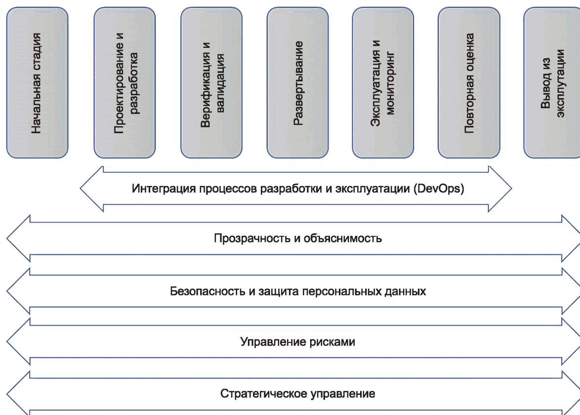
Рисунок 2 — Пример стадий и высокоуровневых процессов в модели жизненного цикла системы ИИ